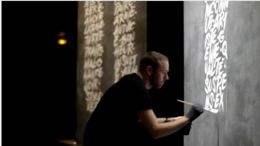
TYRSA (Splendens Company) Hôtel Gaston.